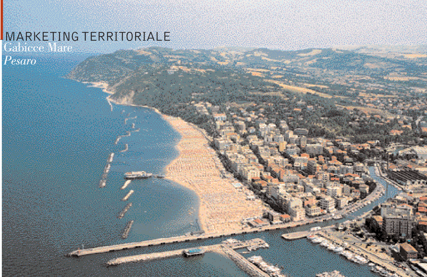
Veduta aerea di Gabicce Mare con il Monte San Bartolo alle spalle. Il canale navigabile la separa da Cattolica, con cui confina. Sotto, il porticciolo turistico ai piedi del Monte San Bartolo