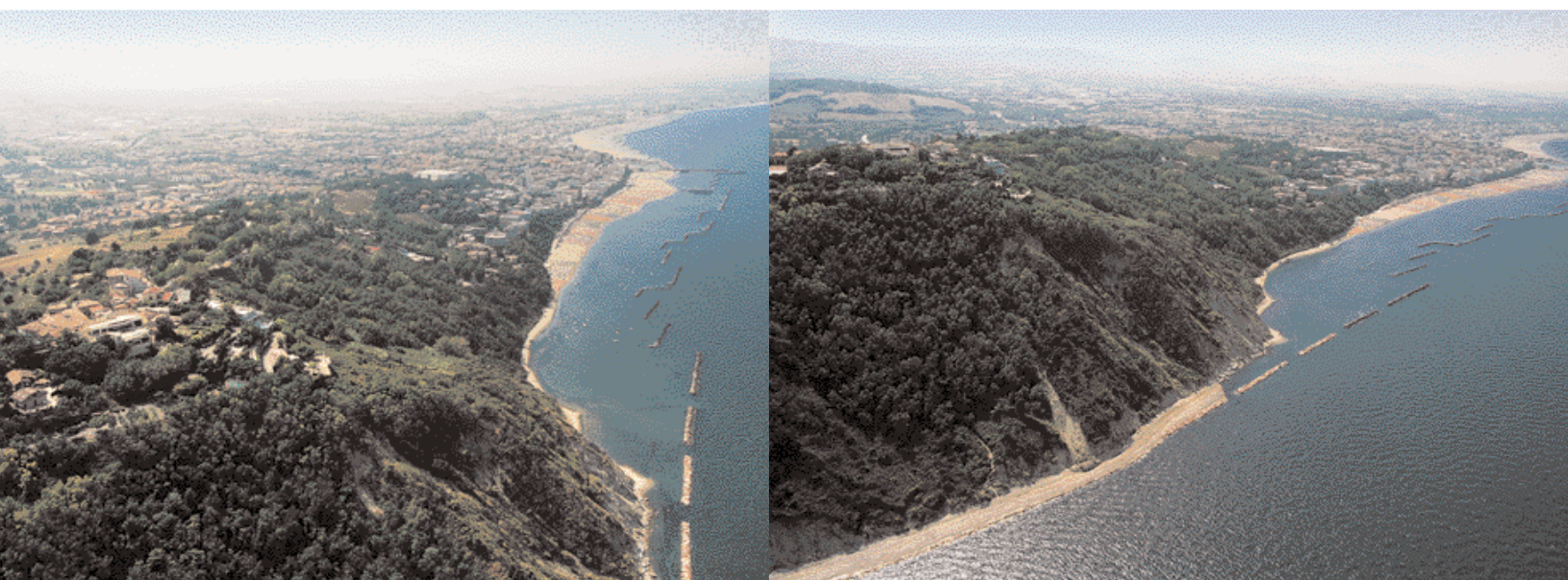
Vedute aeree del Parco Naturale Regionale del Monte San Bartolo e uno scorcio di Firenzuola di Focara

con l'adiacente Cattolica, più grande, mondana e... rumorosa, soprattutto dal punto di vista dell'iniziativa promozionale, che la vede spesso e volentieri al centro delle cronache turistiche italiane. "Il turismo moderno non si accontenta più del sole e del mare, vuole proposte più circostanziate e noi possiamo proporre un ambiente naturale unico sulla costa adriatica italiana. Siamo una realtà di frontiera, tra Romagna e Veneto più a Nord, e il centro dell'Adriatico (Marche, Abruzzo e Molise) più a Sud. Siamo facilmente accessibili dalla Pianura Padana e dal Centro Europa, posti come siamo all'inizio della dorsale appenninica, con gli aeroporti di Rimini e Falconara a un pugno di chilometri, con l'autostrada e la ferrovia alle immediate spalle, e nello stesso tempo offriamo un'oasi di pace e di tranquillità che ci differenzia nettamente dalla costiera romagnola, con il parco da vivere sopra di noi e i suoi percorsi ciclistici e motociclistici, con un reticolo infinito di sentieri pedonali da ripristinare, con la presenza di una fauna assai ricca che va dalle volpi alle lepri agli istrici, dai gabbiani che nidificano sui costoni a mare del monte a un'infinità di altre specie alate che trovano asilo in questo incredibile polmone verde."