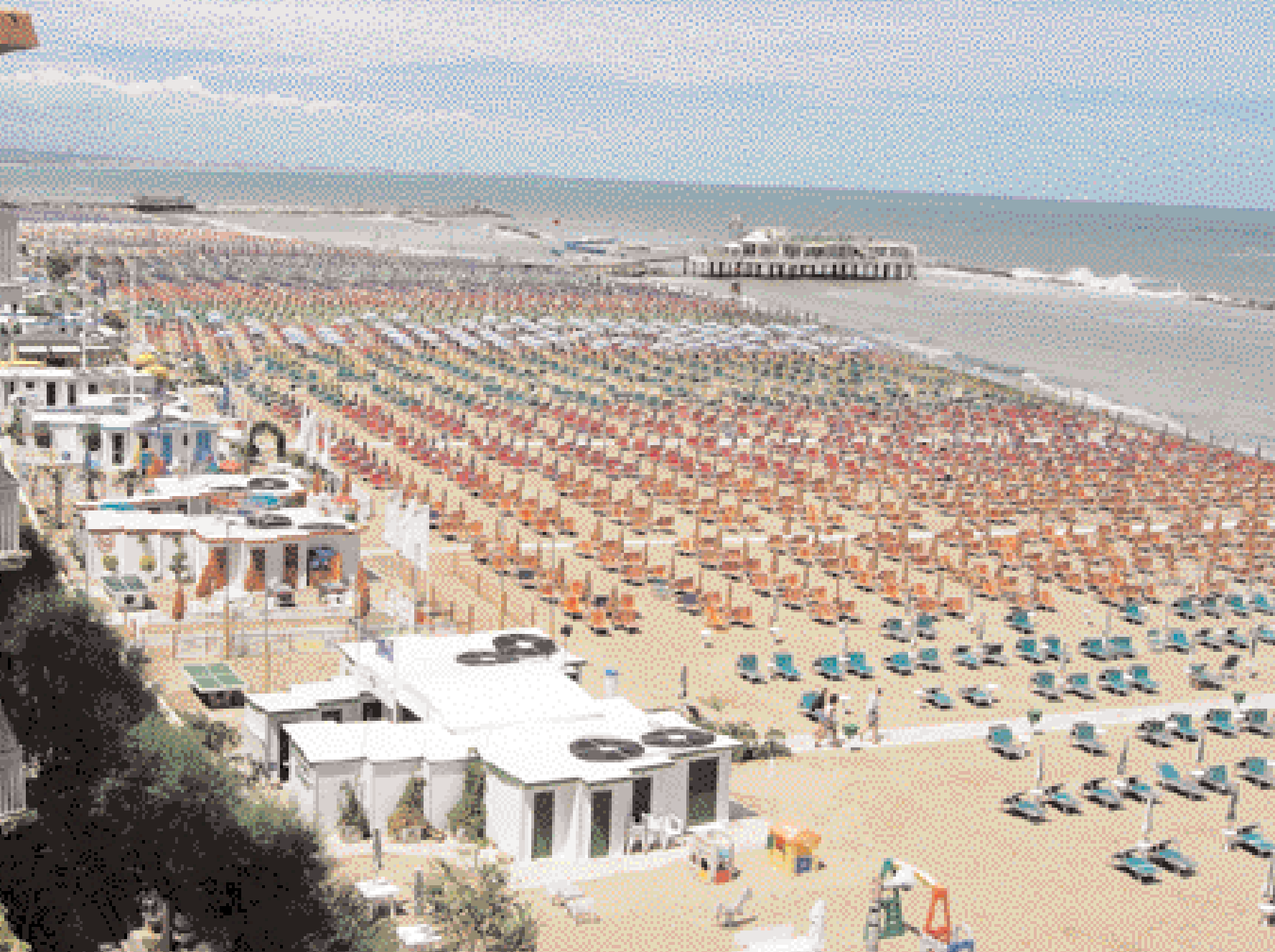
Un'altra veduta della spiaggia di Gabicce Mare a inizio autunno in una giornata di vento. Gli ombrelloni chiusi rivelano la profondità della spiaggia