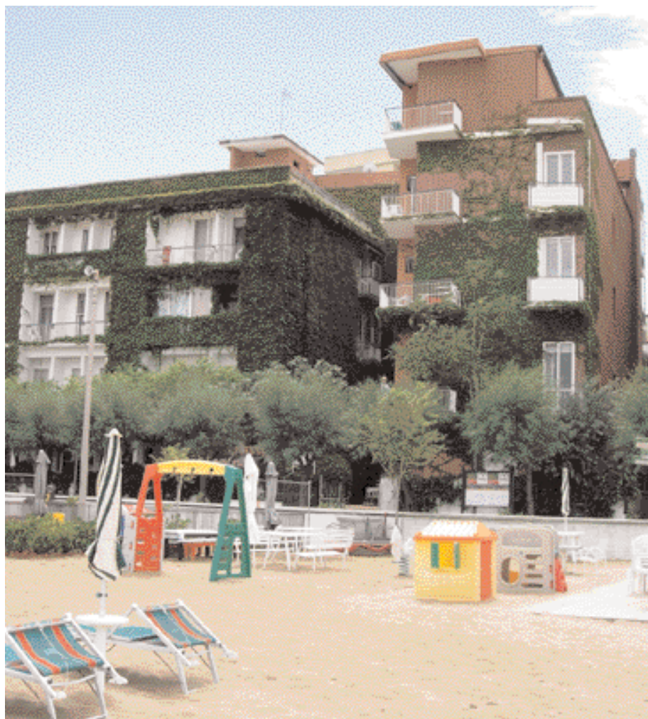
L'Hotel Giovanna Regina, affiliato ai Logis d'Italia Hotels & Restaurants

Gabicce Monte, grazie alla sua posizione sopraelevata, nel passato